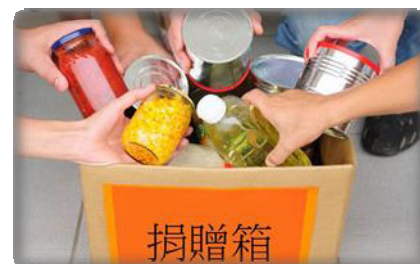
捐贈剩餘可食用的食物給慈善機構