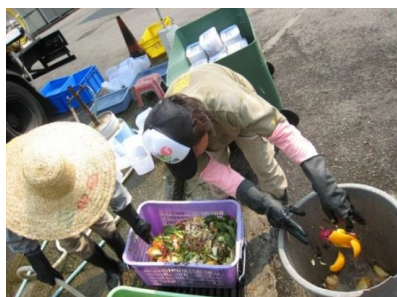
培訓環境及衛生承辦商認識可回收廚餘 環境及衛生承辦商須把不能回收的東西篩選出來