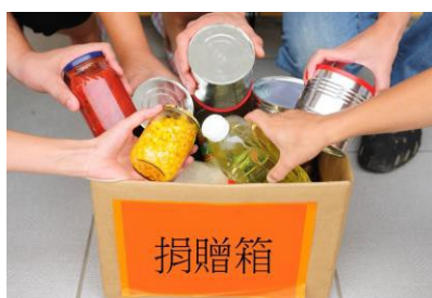
捐贈剩餘食物給慈善機構