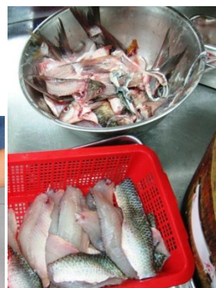
重用配菜／剩餘食材， 製作其他菜式