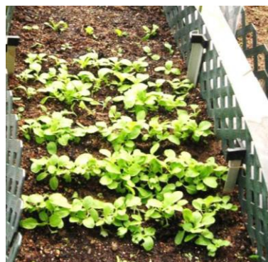
在綠化地區或綠色空地使用堆肥