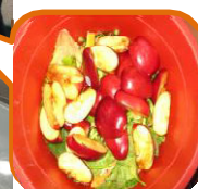
把廚餘分類，方便循環再造