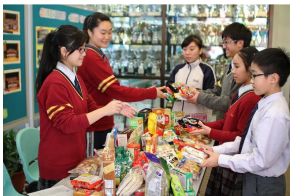
與志願機構合辦食物捐贈計劃