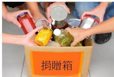
捐贈剩餘可食用的食物給慈善機構