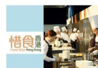
Food Waste Reduction Good Practices Guide for Shopping Malls Sector Food Wise Hong Kong Campaign May 2013