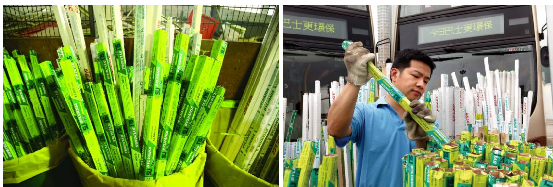
各車廠及總修中心設有收集點，以便回收廢光管