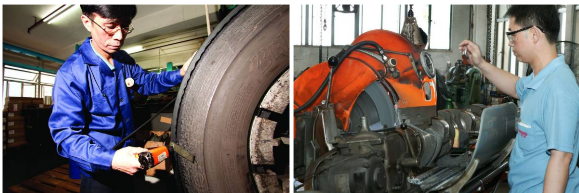
九巴設有車胎翻新儀器把舊車胎翻新重用，減少廢物的產生