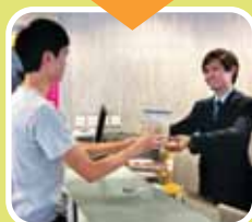
Basurang pagkain ay dinadala sa Pinagsamang Punto ng Pagkolekta ng mga residente