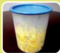
Paghiwalay ng pinagmulan ng pagkaing basura ng mga residente