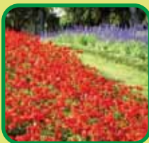
Ang kompost ay maaaring gamitin sa pag-landscape

Maaaring direktang mabawasan ng pagresiklo ng basurang pagkain ang dami ng basurang itatapon sa mga landfill. Ang basurang pagkain ay maaaring maresiklo sa kompost sa pamamagitan ng kagamitan sa pag-kompost sa mga estate ng pamamahay. Ang kompost ay magagamit bilang organic na fertilizer o pangkondisyon ng lupa, na may mas balanseng nilalamang nutrisyon kaysa sa kemikal na pataba at makakatulong na pagtutuhin ang mga ari-arian ang lupa. Ang mga estate ng pamamahay ay maaaring makapag-apply ng kompost sa mga tanim para sa pag-landscape.