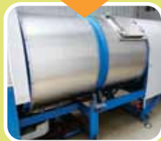
Ang basurang pagkain ay nililipat at nilalagay sa kagamitang pang-kompost ng kawani ng mga estate ng pamamahay