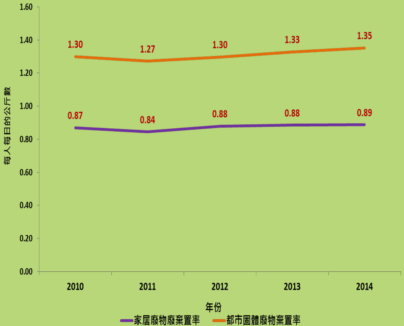
二〇一〇至二〇一四年都市固體廢物及家居廢物的人均棄置率